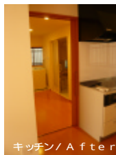
キッチン / After

既存の大きなL型のキッチンを小さくし、隣の駐車場に新しく作った、浴室・洗面・トイレへダイニングキッチンから行き来ができるようにしました。