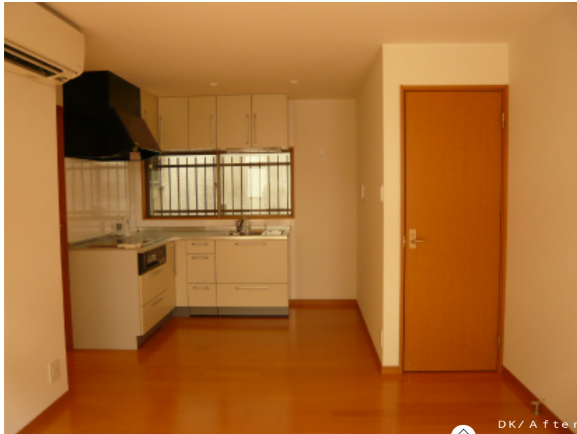
DK / After