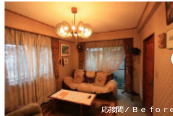
応接間 / Before