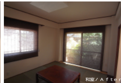
和室 / After

元々駐車場の場所を縮小させ新しく風呂・洗面脱衣・トイレを設けました。たつぷりと移動のスペースを確保していますので介助者さん付添いの移動でも不自由なく行うことができます。