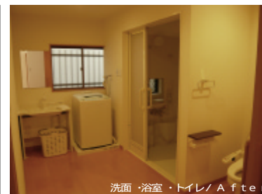
洗面・浴室・トイレ / After