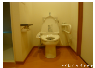
トイレ / After