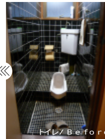
トイレ / Before