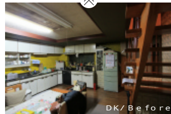
DK / Before

既存の大きなL型のキッチンを小さくし、隣の駐車場に新しく作った、浴室・洗面・トイレへダイニングキッチンから行き来ができるようにしました。