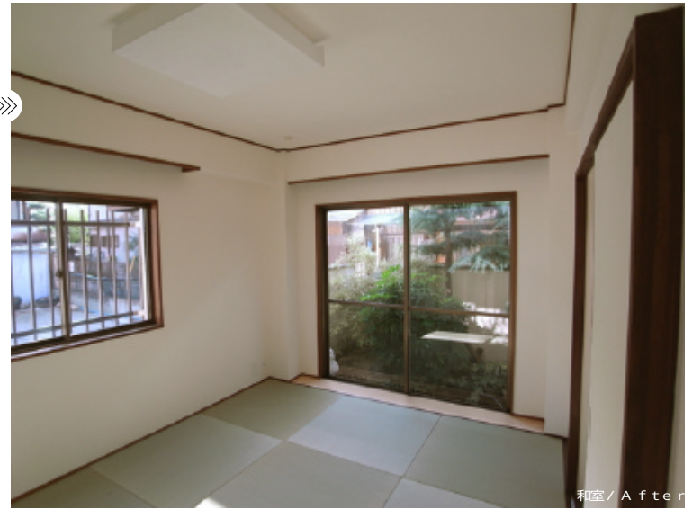
和室 / After

階段下のトイレの為、天井高が低く床には段差がありましたが、フラットな床にして移動がしやすいようにしました。