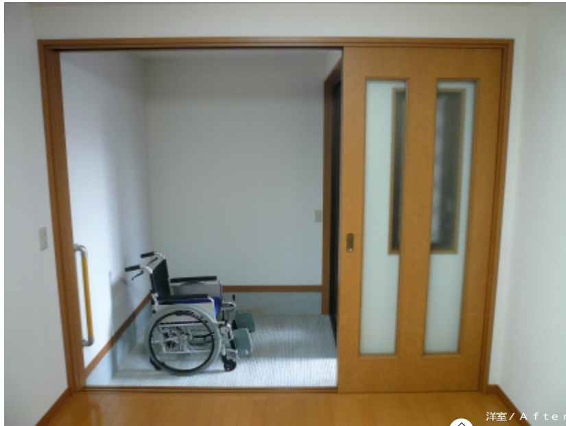
洋室 / After