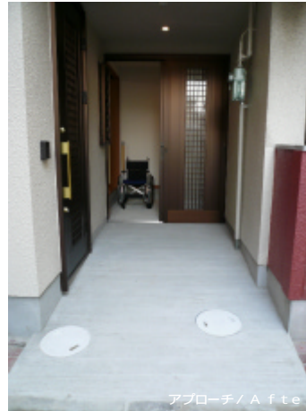
アプローチ / After

暗く、車椅子では出入りのしにくい開き戸の玄関でしたが、車椅子専用の玄関スペースを作り門扉を外しました。玄関土間はスロープになっていますので、1人で移動も可能です。