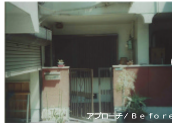
アプローチ / Before

暗く、車椅子では出入りのしにくい開き戸の玄関でしたが、車椅子専用の玄関スペースを作り門扉を外しました。玄関土間はスロープになっていますので、1人で移動も可能です。