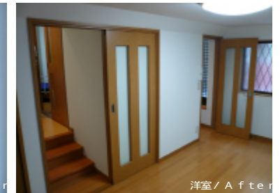
洋室 / After