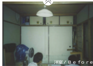
洋室 / Before

改修前は押入だった部分を壊し介護者用の玄関としました。車椅子も十分に置けるスペースも確保していますので、外出の支度もご自身でしていただけます。玄関前はすぐに寝室スペースとなっています。