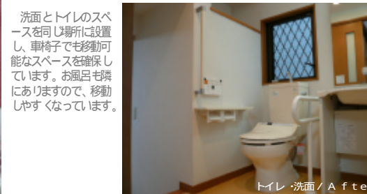
トイレ・洗面 / After