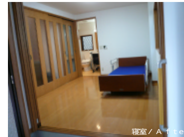
寝室 / After

既存の玄関スペースより前に出し洋室への行き来が出来るスペースを確保しました。介護者様用の寝室。専用の玄関からすぐに出入りができ、トイレなどへの移動もスムーズにおこなう事ができます。