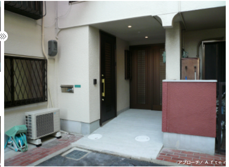
アプローチ / After