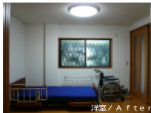
洋室 / After

改修前は押入だった部分を壊し介護者用の玄関としました。車椅子も十分に置けるスペースも確保していますので、外出の支度もご自身でしていただけます。玄関前はすぐに寝室スペースとなっています。